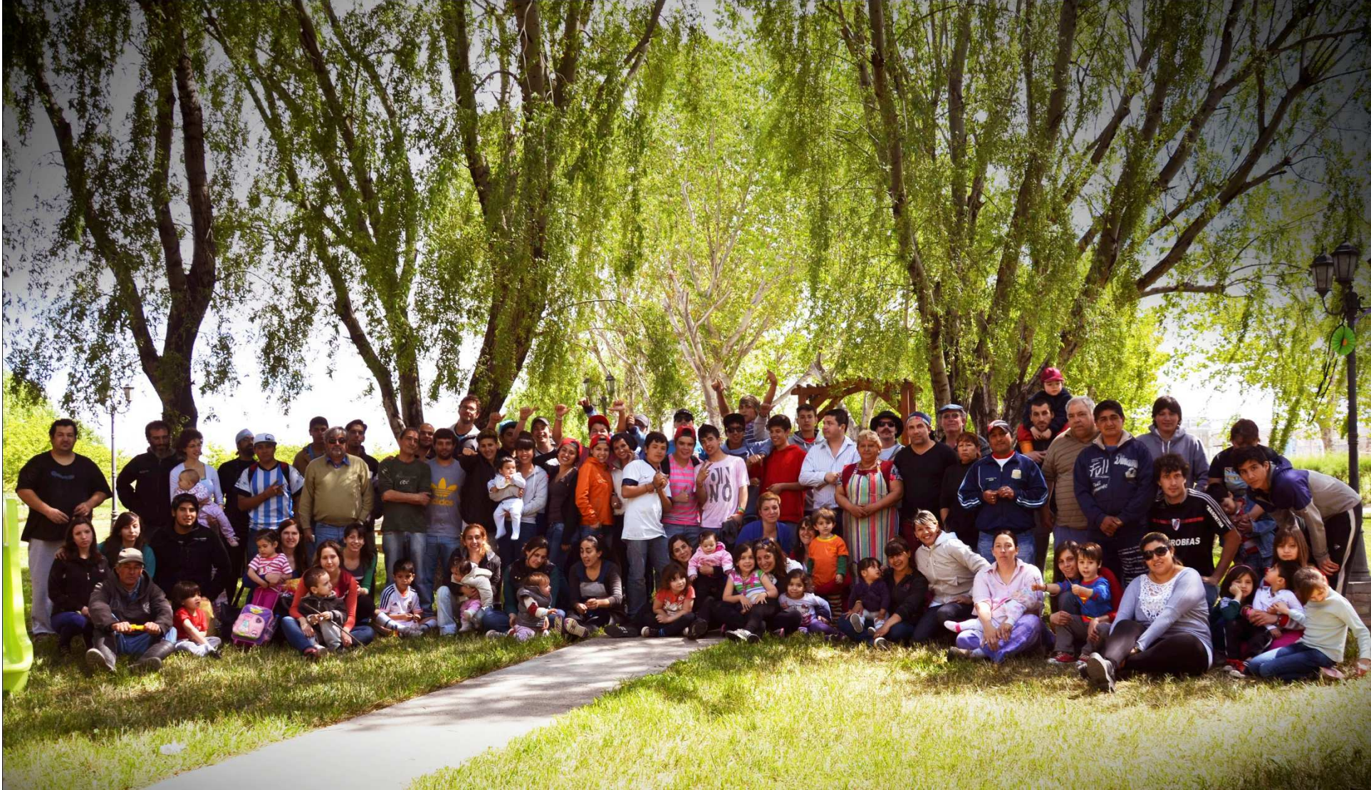
Fundación Ceferino Namuncurá 17-10-2014