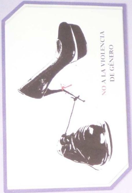
NO A LA VIOLENCIA DE GÉNERO